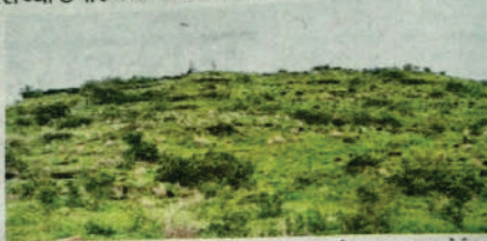
एमजीएमच्या गांधेली येथील या टेकडीवर महावृक्षारोपण करण्यात येईल.

औरंगाबाद | दिव्य मराठीच्या 'एक वृक्ष एक जीवन' अभियानांतर्गत रविवार, ७ ऑगस्ट रोजी महावृक्षारोपण कार्यक्रमाचे आयोजन करण्यात आले आहे. यासाठी गांधेली येथील एमजीएम संस्थेची सर्व महाविद्यालय संज्ञा झाली आहेत. या वेळी किमान दोन हजार झाडे लावली जाणार असून अनेक संस्था, स्पर्धना आणि विविध क्षेत्रांतील मान्यवर सहभागी होणार आहेत. सकाळी १० वाजता वृक्षारोपण कार्यक्रमाला सुरुवात होणार असून एमजीएम संस्थेचा संपूर्ण स्टाफ त्यासाठी जोरदार तयारी करत आहे.